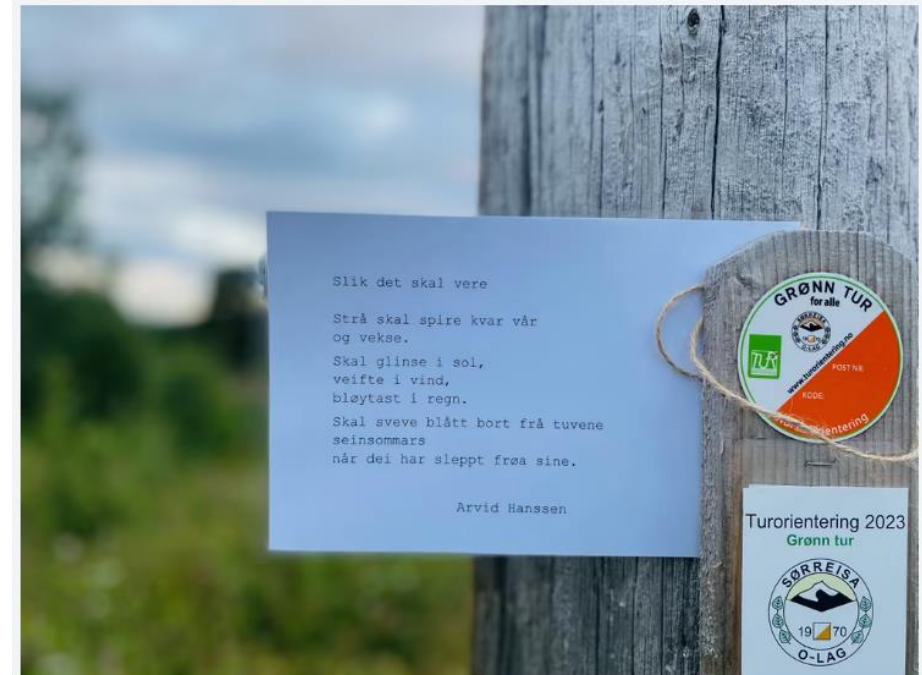
GRØNN TUR: Lørdag 22. juli åpnes KulTurO-løypa i Brøstadbotn – med dikt av Arvid Hanssen.

Lørdag 22. juli begynner sommerens kultur dager i Dyrøy. Da åpnes også «KulTurO-løypa» i Brøstadbotn – med dikt av Arvid Hanssen.