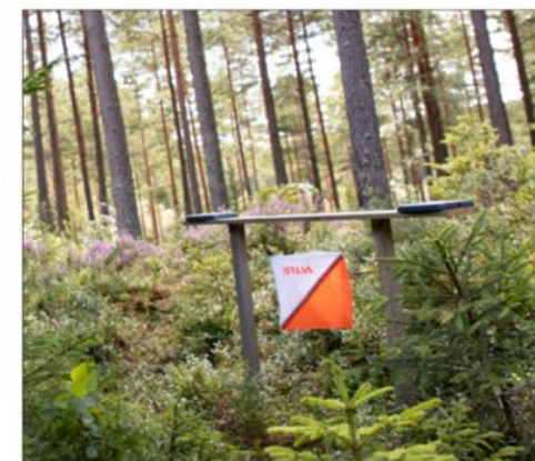
TURORIENTERING: I sommer settes det ut 260 poster i kommunene Bardu, Målselv, Sørreisa og Dyrøy.

Hvert område/kart utgjør en tur. Hver tur har ulik vanskelighetsgrad og har fått en farge som tilsvarer vanskelighetsgraden, der grønn er lettest og svart er vanskeligst.