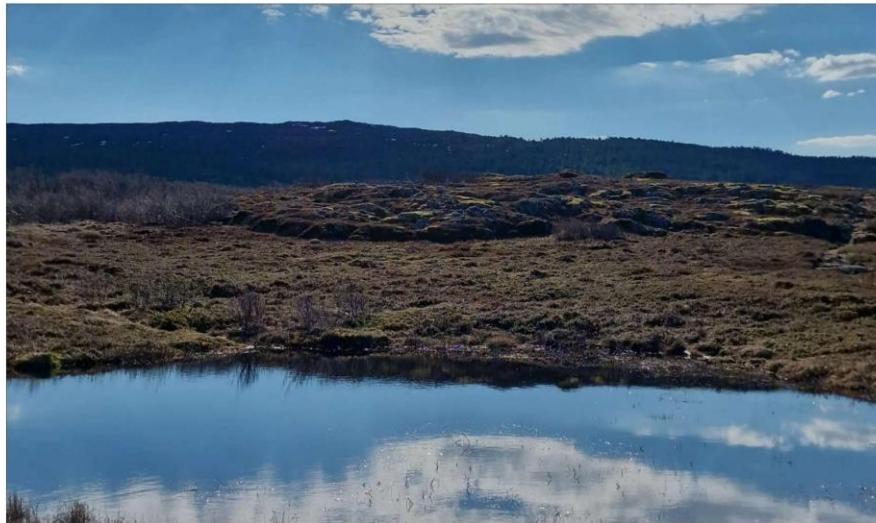
VAKKERT: Endelig er det mulig å løpe orientering på Sør-Tranøy på Senja igjen.

– Vi klarer ikke å få til organisert idrett i idrettslaget, og da måtte vi tenke utenfor boksen. Hva kan vi gjøre for å få folk i