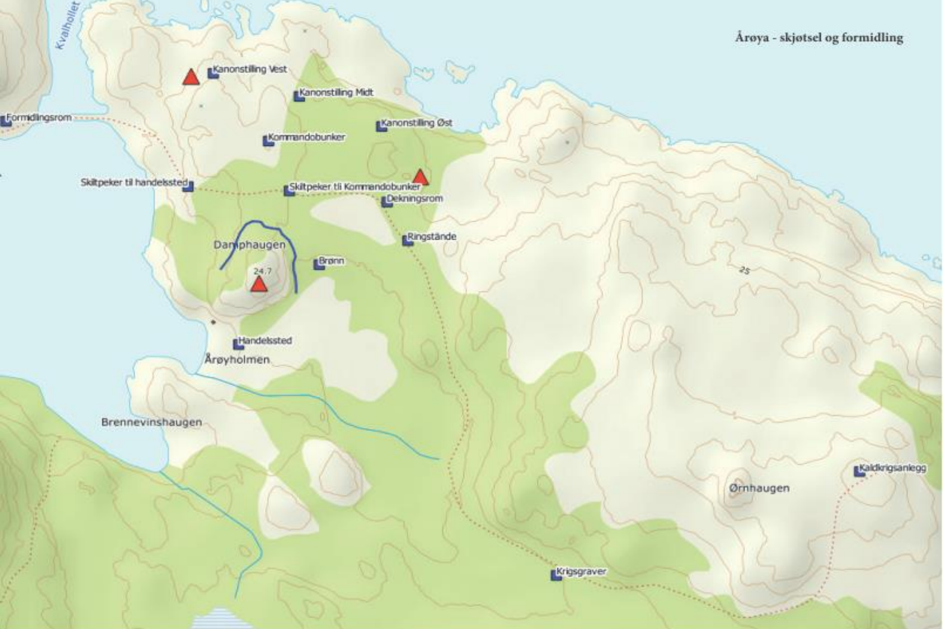
Kart over tiltaksområdene som er nærmere beskrevet i planen. De røde trekantene markerer områder hvor det er/må vurderes behov for sikringstiltak.