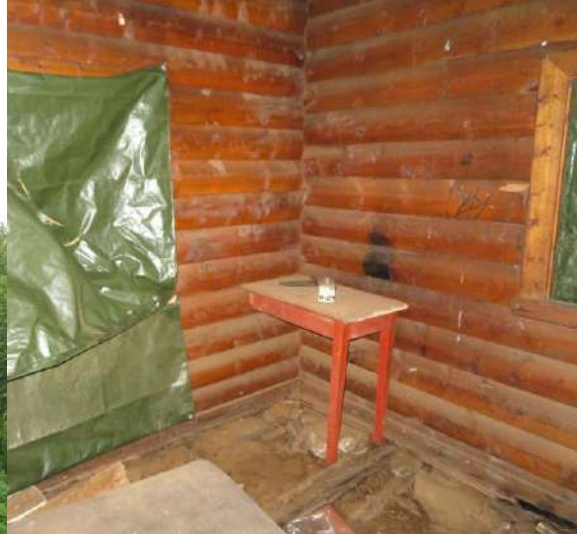
Fra gammel rønne til byens felles hytte