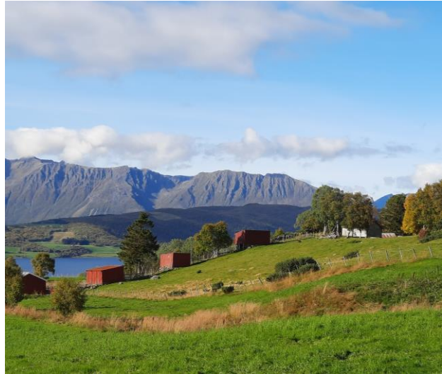
«Sommerfjøsgrenda» i Skallan-Rå

I Norge er det 44 utvalgte kulturlandskap i jordbruket. Fire av disse er i Troms og Finnmark.