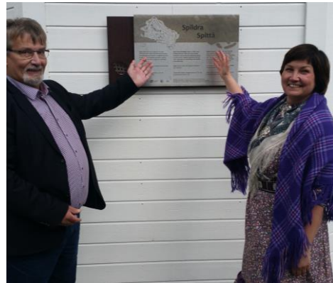
Fylkesordfører og sametingspresident åpner kulturstien på Spildra