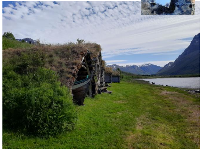
Fjærabuene i Birtavarre – Kåffjord kommunes Fotefar

Fotefar mot nord er et stort prosjekt som har sin opprinnelse på 1990-tallet. Vi arbeider nå med å få revitalisert Fotefar.