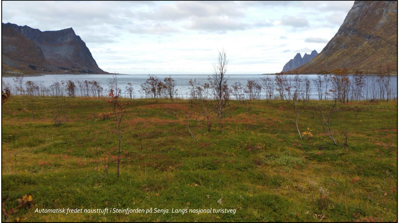
Automatisk fredet nausttuft i Steinfjorden på Senja. Langs nasjonal turistveg