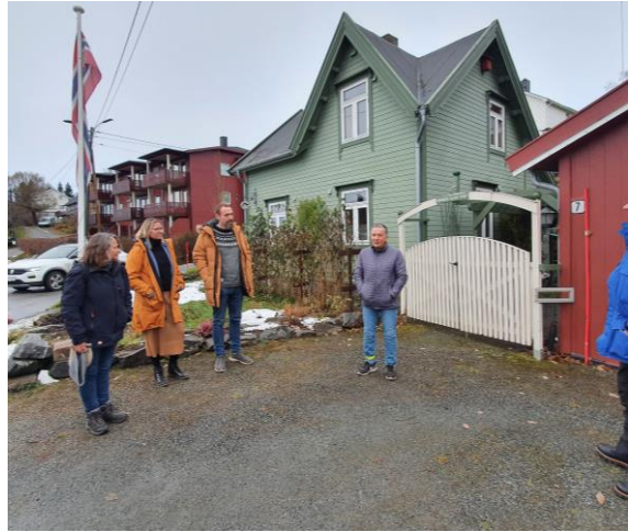
Oppstart av KIK i Senja kommune – fra befarings på Kroken gård