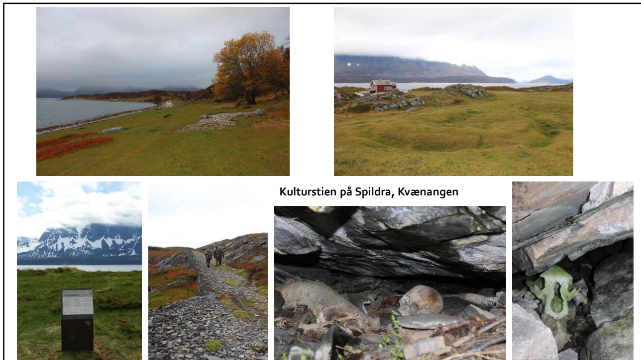
Kulturstien på Spildra, Kvænangen

Spildra har hatt bosetting tilbake til steinalder, og pga kraftig beitetrykk er landskapet velholdt og kulturminnene i marka er godt synlig, bla.a denne tufta (øverst til høyre) av et hus som stod her for minst 1000 år siden. En gammel veg bygget som nødsarbeid på 1930-tallet er også et kulturminne.